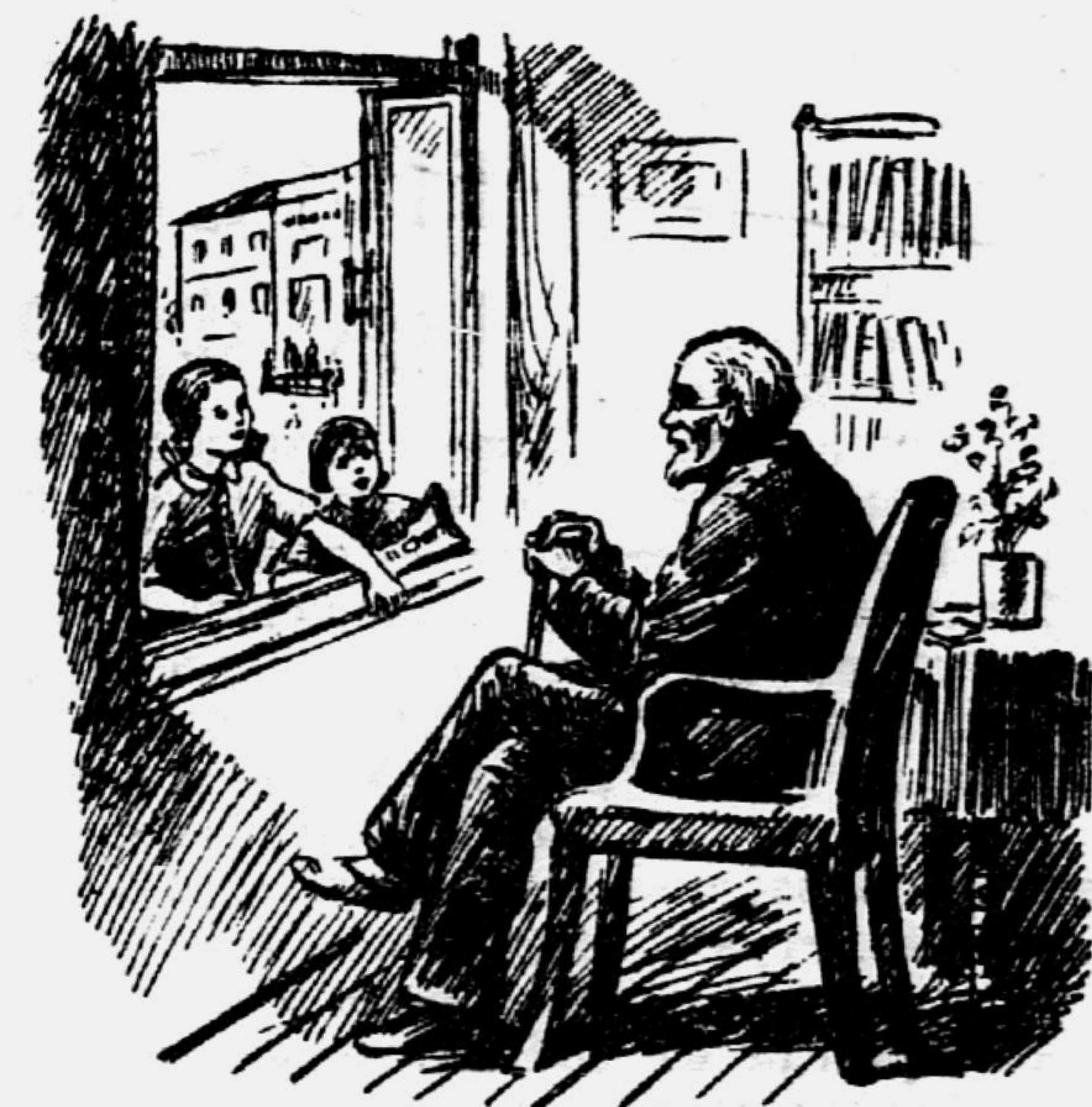
Рис. Л. СМЕХОВА

линии снова появятся молодые побеги. А в это время в комнату к тебе ворвётся этакая резвушка, схватит свёрток с бельем и побежит к реке стирать. Забежит другая, раскроет окно.