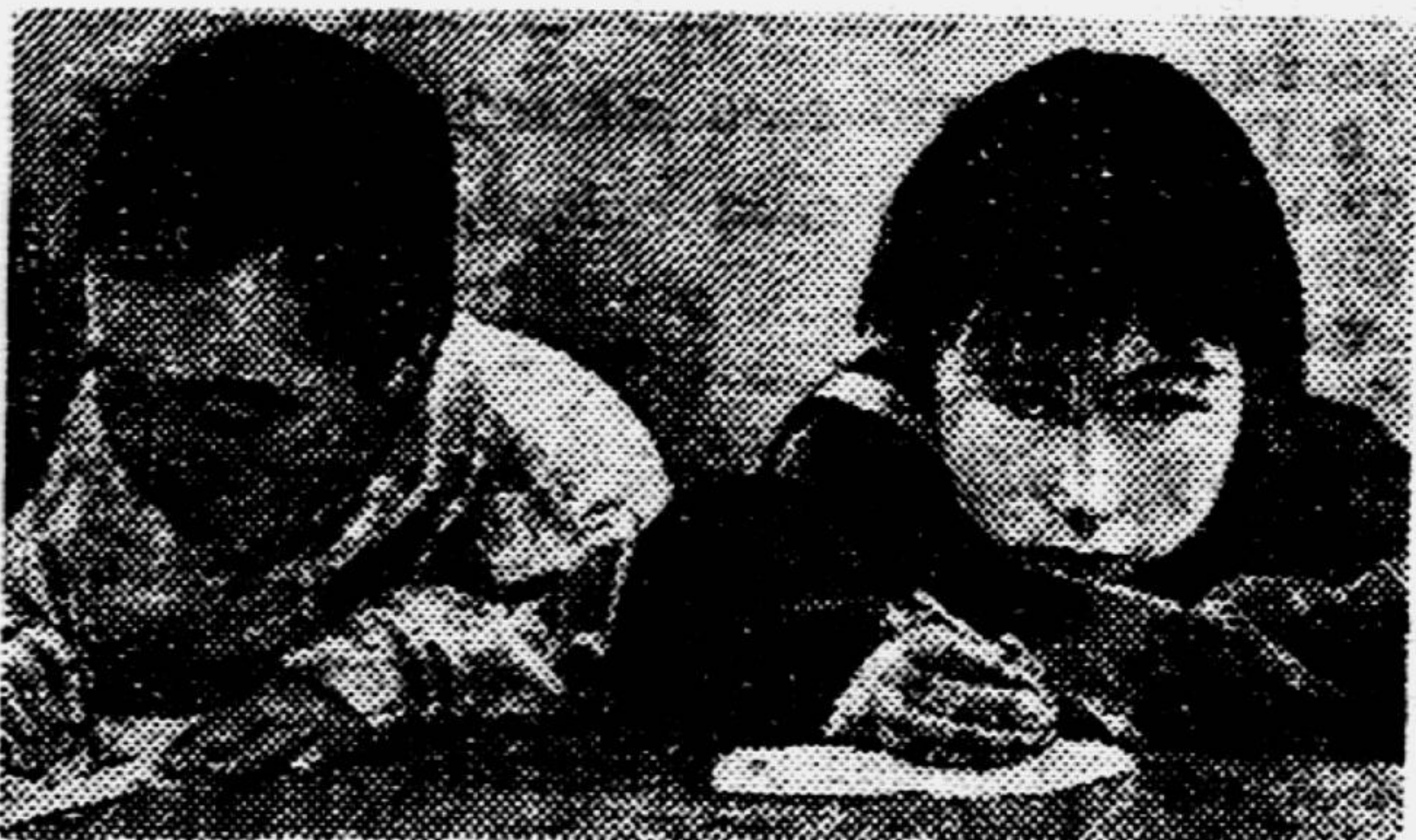
Маленькие коряки в школе.

Камчатку населяет больше десятка народностей. В городах, колхозах, на рудниках и в стойбищах, кроме русских, живут камчадалы, чукчи, эскимосы, юкагиры, ламуты, алеуты и другие представители народов Крайнего Севера. Не многие из них помнят ещё те тяжёлые дореволюционные времена, когда Камчатка была поистине диким, забытым краем, где на весь полуостров площадью в 1.200.000 квадратных километров был только один врач. Население Камчатки тогда было сплошь неграмотным. И как радостно видеть сейчас маленьких чукчей и коряков, обучающихся на родном языке.