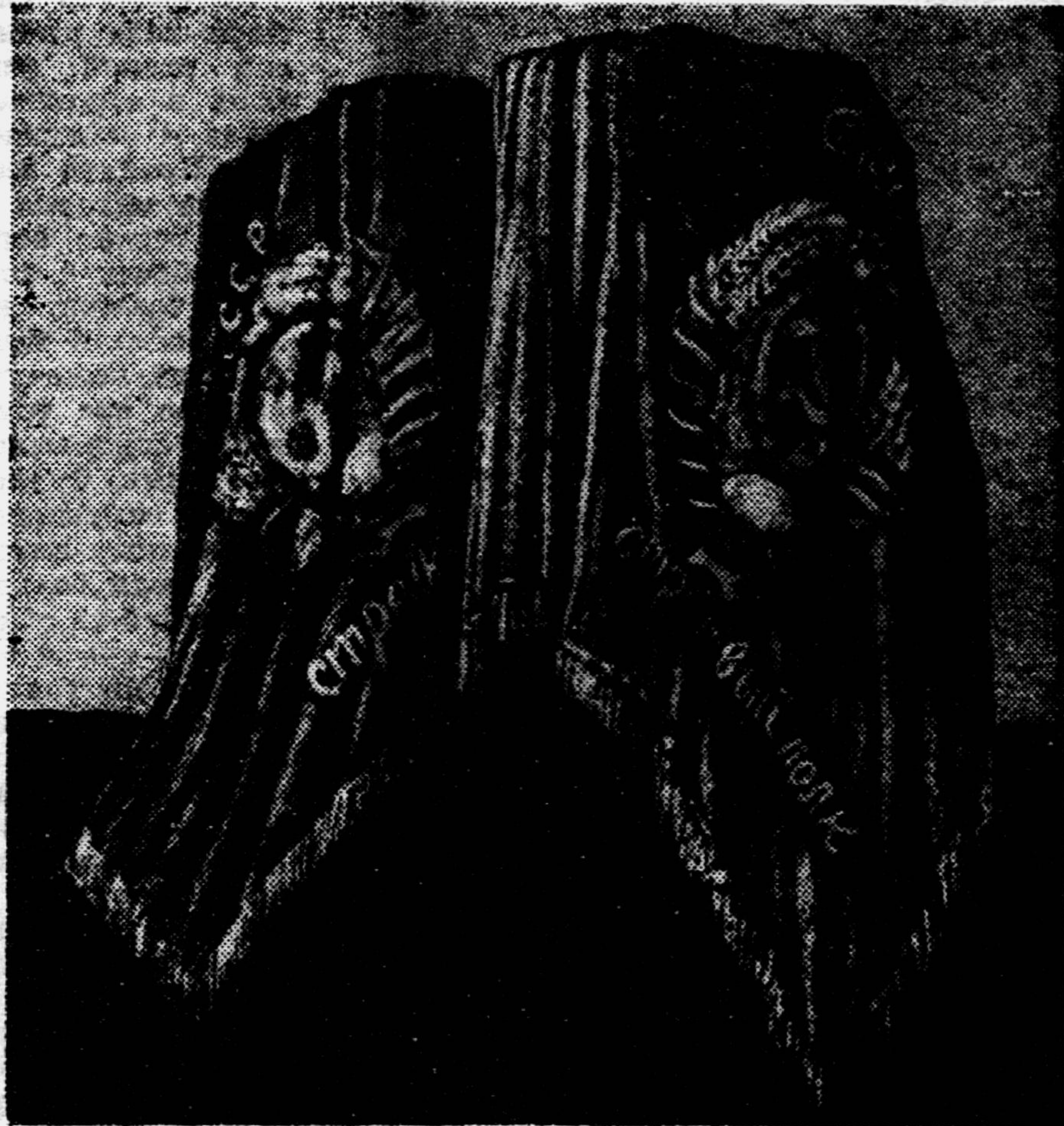
Боевые знамена, которые спас Костя Кравчук.