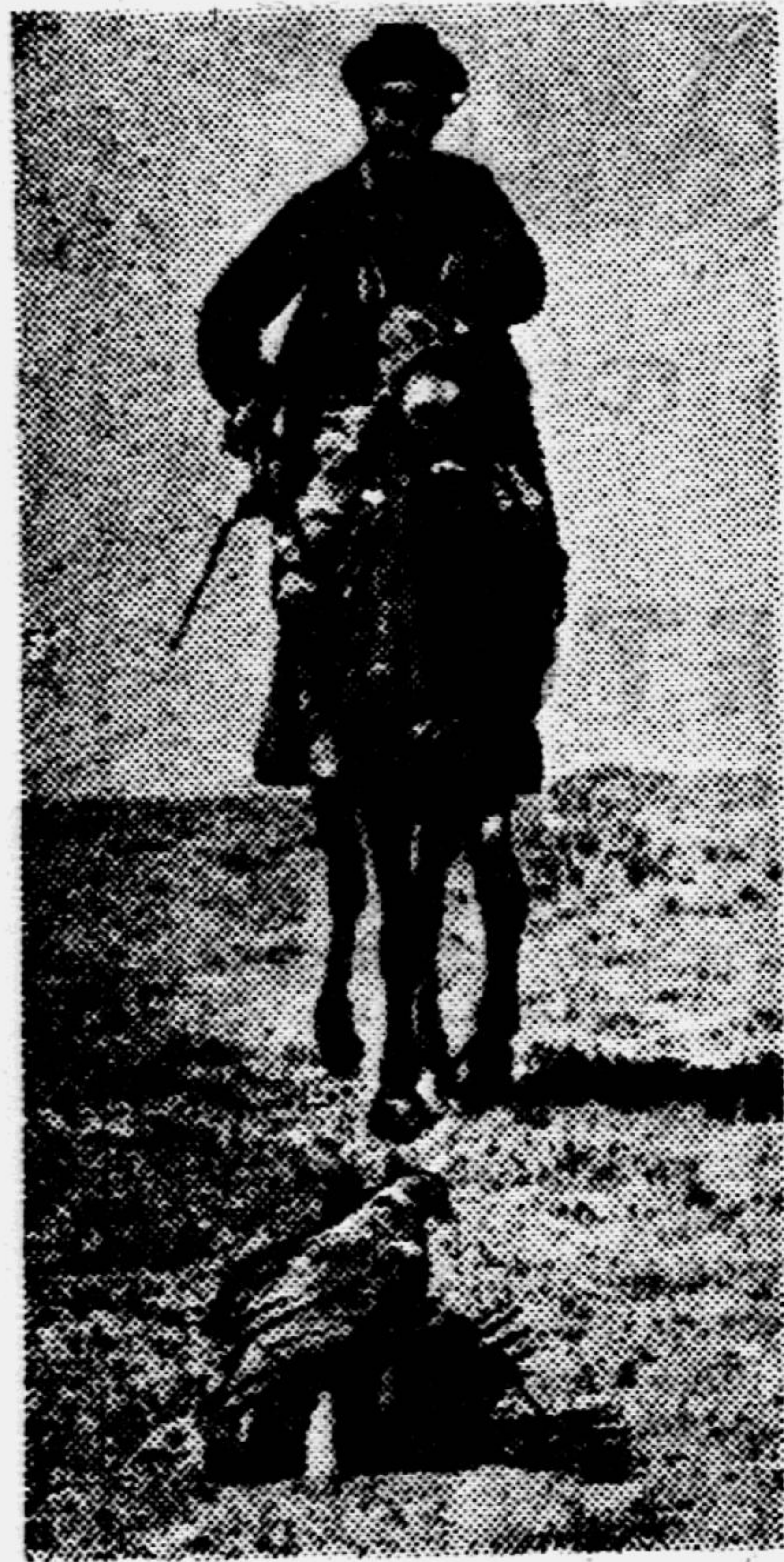
Колхозники Казахстана любят старинную охоту с беркутом — птицей из рода орлов. Колхозный пастух Байбол Молдалиев добывает такой охотой много дичи.