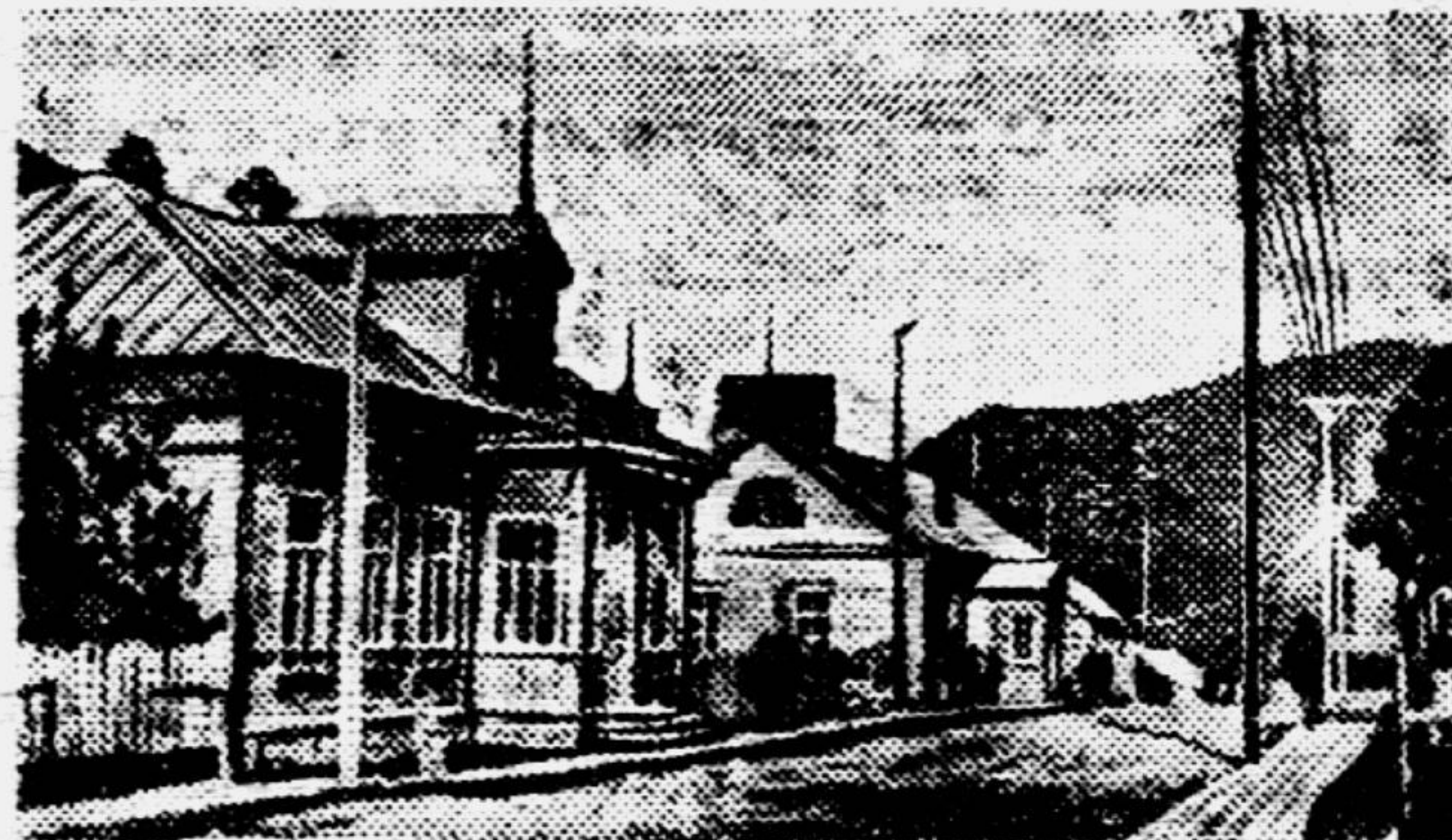
Улица в Петропавловске.

...Вот на горизонте в волнах появилось огромное тёмное пятно, над которым высоко поднимается фонтан. Теперь надо подойти поближе, не спугнув кита. Вот он перед нами — двадцатиметровая громадина. Наступает решающий момент — по киту бьют из гарпунной пушки. Гарпун на верёвке, а внутри его заложен взрывной снаряд большой силы. Снаряд разрывается в теле кита. Ощущаемый на судне сильный рычок каната и фонтан кровавых брызг говорят об удаче меткого гарпунёра. Кит со страшной силой бросается в стороны, стараясь уйти от охотников. Проходит несколько минут, и обессиленного морского гиганта подтягивают к борту китобойца. В тушу кита вставляют резиновый планг, и машина накачивает в него воздух. Теперь можно не опасаться, что издохшее животное утонет. На буксире его доставляют к «Алеуту». На борту судна открываются огромные ворота, и кита втягивают на палубу. Здесь — настоящая фабрика. Быстро и ловко разделяют тушу. В обширных котлах вытапливаются ценные сорта жира. Костедробильные машины превращают колоссальный скелет в муку. Мясо, кожа — всё идёт в дело. Сколо 400 китов добывают за сезон отважные советские китоловцы.